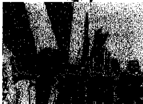
▲地域イベントを応援