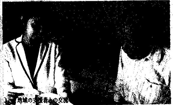
地域の支援者との交流