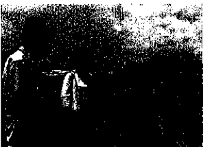
▲砂防策など海岸保全を！