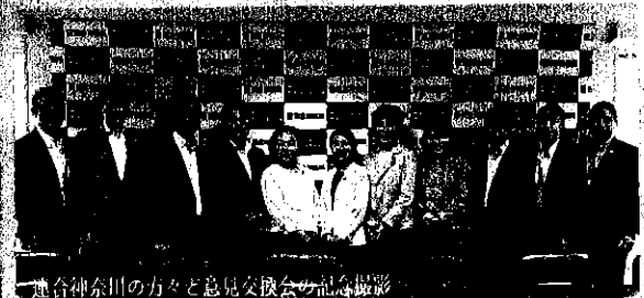
鎌倉市の方々と意見交換会の記念撮影