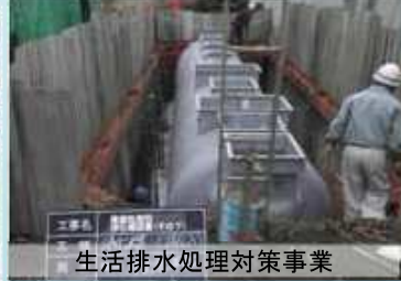
生活排水処理対策事業