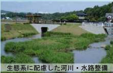
生態系に配慮した河川・水路整備

「将来にわたり県民が必要とする良質な水の安定的確保」を目指し、生態系に配慮した河川改修や地下水汚染対策、生活排水処理対策等に取り組めました。