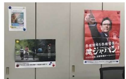
健ジャパ ン掲示中