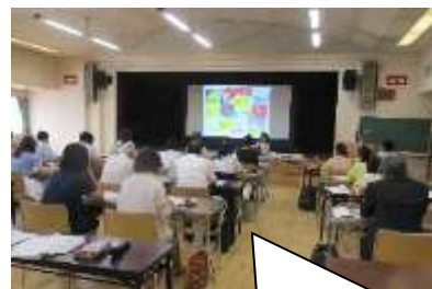
「公民館担当者コース」事例発表の様子

県立図書館と神奈川県公民館連絡協議会*12との共催により、公民館担当者等を対象とする生涯学習指導者研修「公民館担当者コース」を実施し、図書館との連携など読書に関する講座の企画等についての理解を深めてもらうことにより、子どもの読書活動にかかわる人材の育成を図ります。