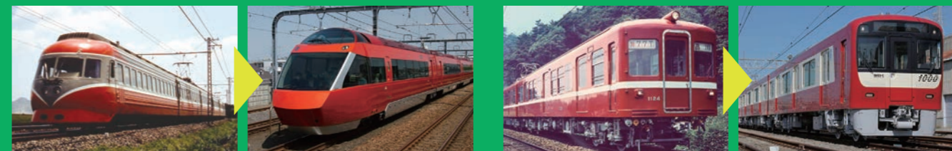
▲小田急電鉄