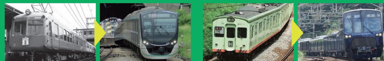
▲東急電鉄