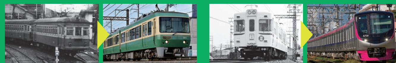
▲江ノ島電鉄