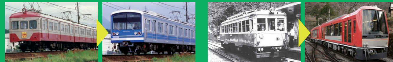
▲伊豆箱根鉄道