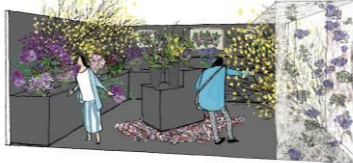
▲屋内出展イメージ