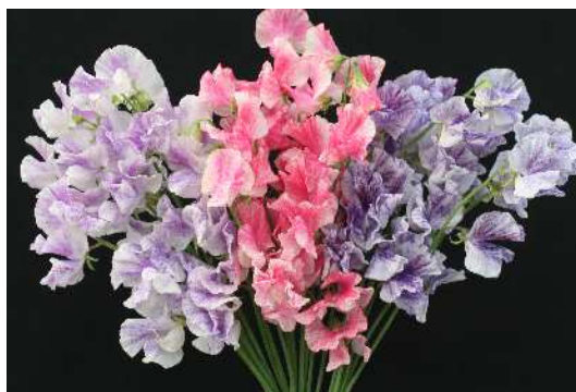
スイートピー "スプラッシュシリーズ"