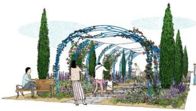
▲屋外出展イメージ

花・緑出展は、庭園作品や生産品の展示、コンペティションへの参加により、技術や魅力を世界へ発信いただける出展方法です。屋外出展と屋内出展があります。