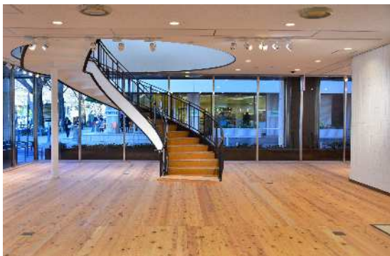
県産木材を使用した室内