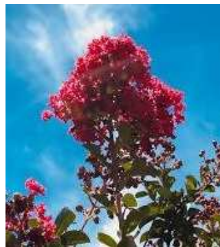
サルスベリ ディアシリーズ