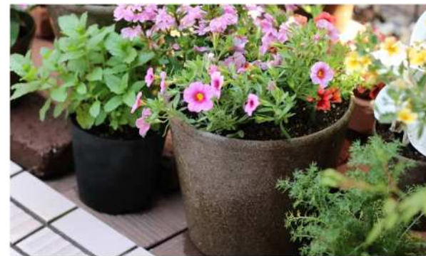
もみ殻や段ボールを使ったポット