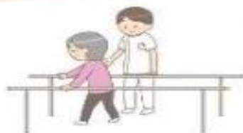
早期の退院に向け、リハビリ、栄養管理等を提供