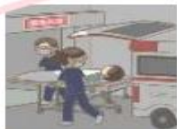
救急患者を受け入れる体制を整備