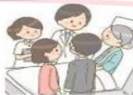
退院に向けた支援 適切な意思決定支援