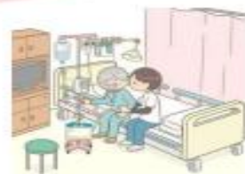
一定の医療資源を投入し、急性期を速やかに離脱