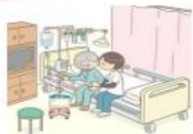
一定の医療資源を投入し、急性期を速やかに離脱