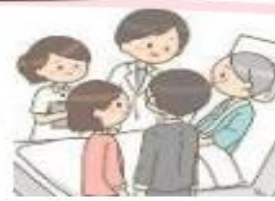
退院に向けた支援 適切な意思決定支援