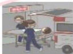
救急患者を受け入れる体制を整備