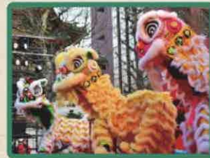
中国の獅子舞 横浜中華学校 校友会国術団