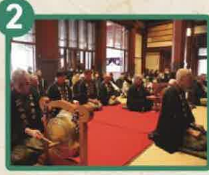
川崎市重要習俗技芸 川崎大師引声念仏 川崎大師双盤講