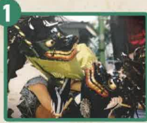
神奈川県指定無形民俗文化財 小向の獅子舞 小向獅子舞保存委員会