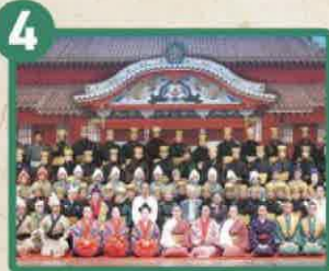
神奈川県指定無形民俗文化財 沖縄の民俗芸能 川崎沖縄芸能研究会