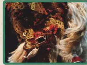
インドネシアの獅子舞 深川バロン倶楽部