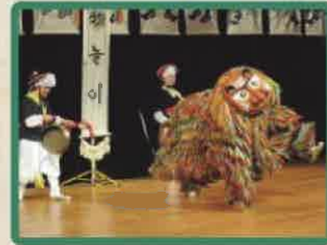
韓国の獅子舞 アンデミ ノルムセ