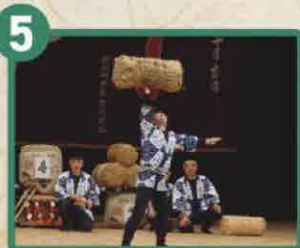
川崎市重要習俗技芸 新城の囃子曲持 新城郷土芸能 囃子曲持保存会