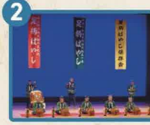
南足柄市指定無形民俗文化財 足柄ばやし 足柄ばやし保存会 (南足柄市)