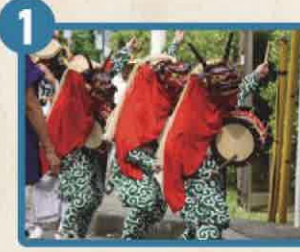
神奈川県指定無形民俗文化財 三増の獅子舞 三増獅子舞保存会 (愛川町)