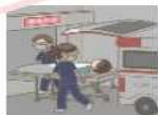
救急患者を受け入れる体制を整備