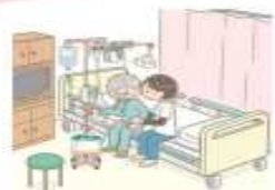
一定の医療資源を投入し、急性期を速やかに離脱