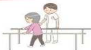
早期の退院に向け、リハビリ、栄養管理等を提供