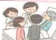
退院に向けた支援 適切な意思決定支援