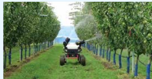
ロボットを活用した果樹栽培の 省力化・軽労化技術開発