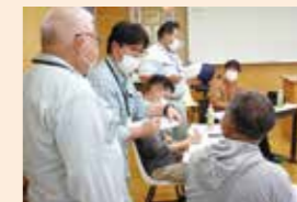
就農5年目までの担い手を 対象とした農業セミナー