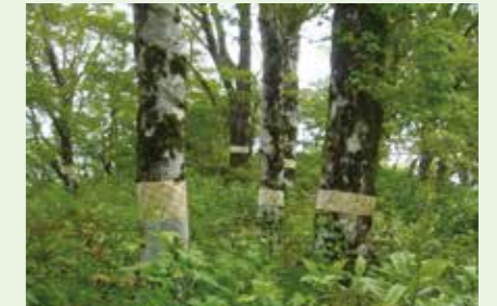
ブナハバチ被害防除試験