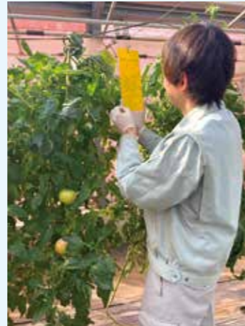
環境負荷を軽減する トマト栽培の試験