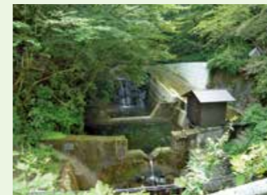
水源かん養機能調査

「かながわ水源環境保全・再生実行5か年計画」に基づき、水源施策の効果をわかりやすく説明するため、また水源施策を柔軟に推進するために、水源かん養機能評価及び生物多様性機能評価にかかるモニタリング調査に取り組んでいます。