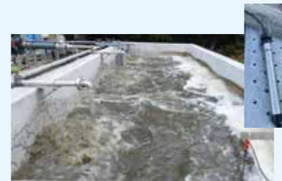
スマート技術を取り入れた浄化 槽のばっ気制御技術の開発