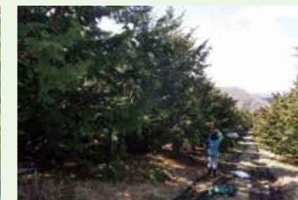
ヒノキの人工交配