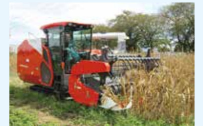
国産濃厚飼料増産のための 子実トウモロコシの生産方法の検討