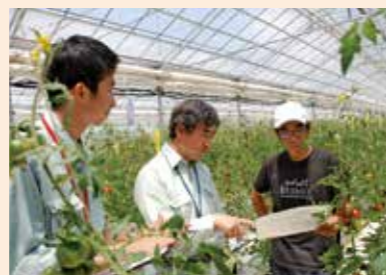
トマト生産者への技術指導