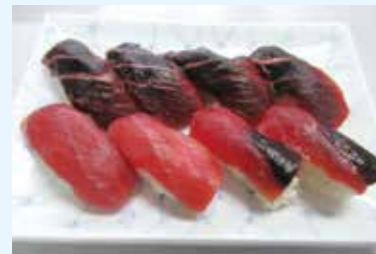
マグロ血合肉を活用した地域特産品の創出