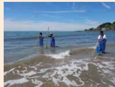
漁業者によるハマグリ調査