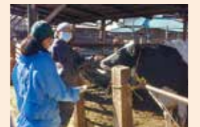
酪農家の交配計画作成支援