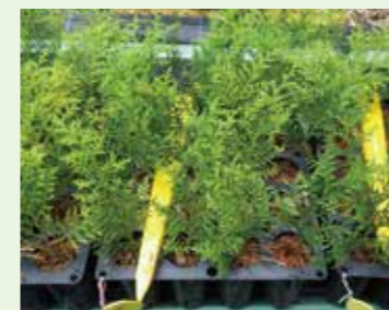
無花粉ヒノキの直さし試験

社会問題になっているスギ・ヒノキ花粉症に対し、これまでの研究成果を基に、無花粉ヒノキの苗木生産実用化及び無花粉スギの苗木生産効率化に取り組んでいます。また、雄花着花量調査に基づく花粉飛散量予測も実施しています。(全国初の無花粉ヒノキ「丹沢 森のミライ (愛称)」令和3年春初出荷・令和4年3月15日品種登録)