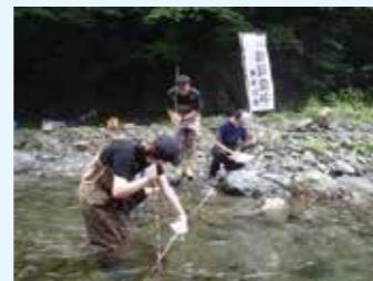
内水面における漁場環境調査