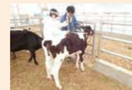
哺乳ロボットで哺乳した 子牛の発育調査