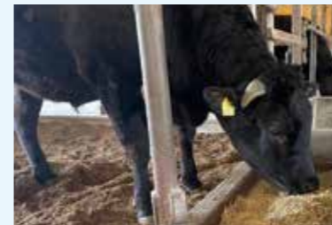
畜産経営における温室効果ガス 削減方法の検討