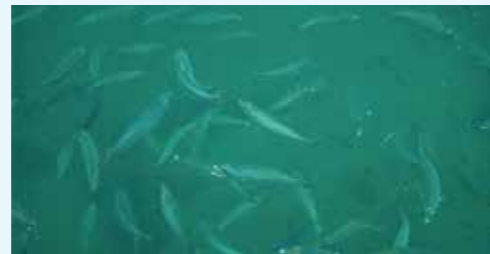
サバの養殖技術開発試験