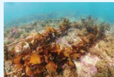
早熟性カジメによる藻場の再生