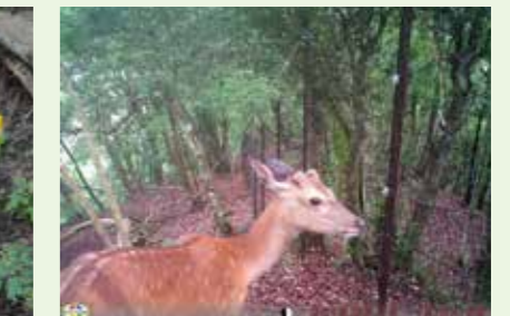
生物多様性機能調査(動物)