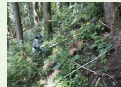
生物多様性機能調査(植物)