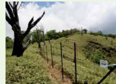
大規模ギャップの森林再生調査

水源林の中でも特に貴重な自然生態系である丹沢のブナ林について、ブナ林衰退機構や対策技術に関する研究成果などをとりまとめた「丹沢ブナ林再生指針」を踏まえ、ブナ林再生事業の検証及びブナ林衰退対策にかかる技術開発に取り組んでいます。