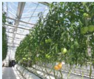
スマート農業の試験を行う 「ICT温室」