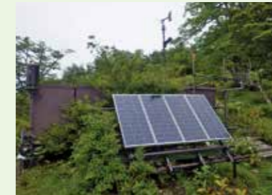
大気・気象モニタリング調査