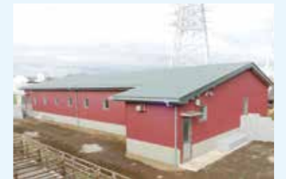
効率的な生産と臭気問題に 対応可能な畜舎の実証研究