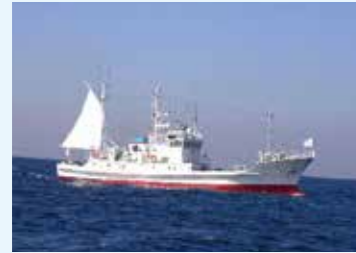
漁業調査指導船江の島丸

県民に新鮮で安全・安心な水産物を安定して提供するための技術開発に取り組んでいます。