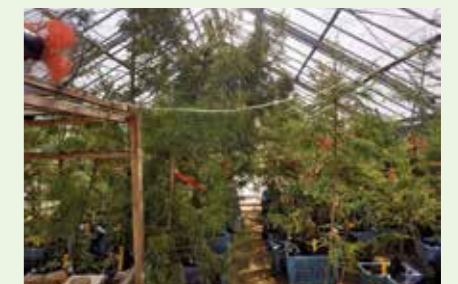
無花粉スギ閉鎖系採種圃