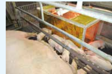
夏季の家畜の暑熱ストレスを 低減するための技術開発