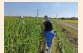
飼料用イネ専用品種の 生育調査