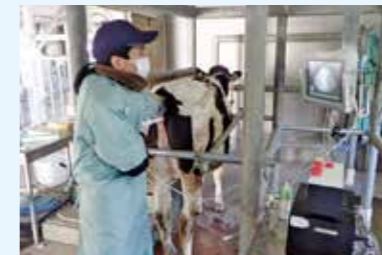
未経産牛を活用した 牛群改良方法の開発