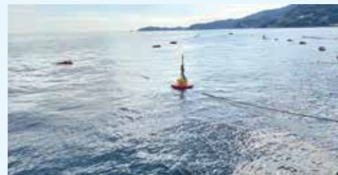
定置網に設置した魚群探知機ブイ