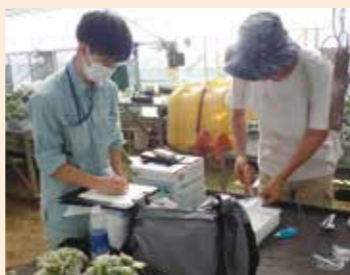
花き生産者への技術指導