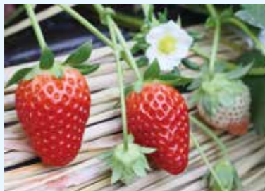
強い甘みと適度な酸味で濃厚な味わいの イチゴ新品種「かなこまち」