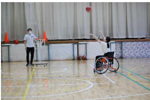
車椅子バスケットボールの体験

また、神奈川県や東京都障害者スポーツ協会等8団体からの依頼を受け、チェアスキーのシミュレータを用いたチェアスキー体験やレーサーを用いた陸上競技体験により障害者スポーツの普及活動をおこなった。