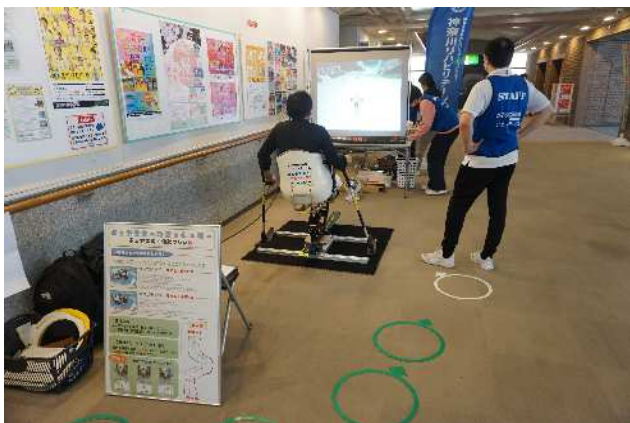
チェアスキーシミュレーターの体験