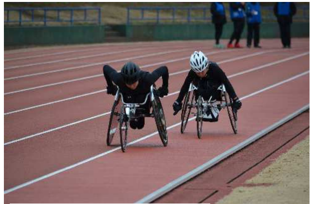
陸上競技（レーサー）の体験