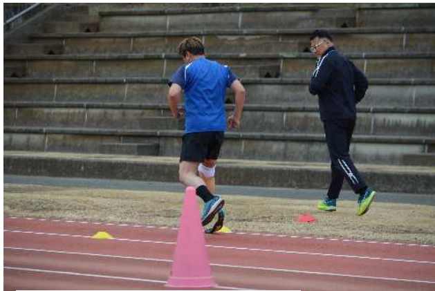
陸上競技（義足）の体験