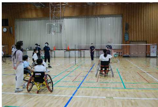
バドミンントンの体験