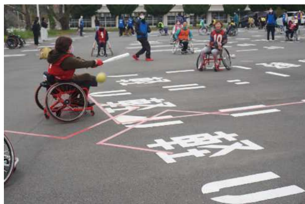
ソフトボールの体験