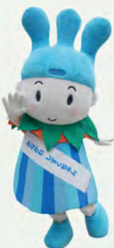
かながわ しずくちゃん

10:30~11:00/12:00~12:30/13:30~14:00/15:00~15:30