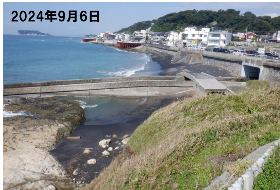
図1 極楽寺側周辺の変遷