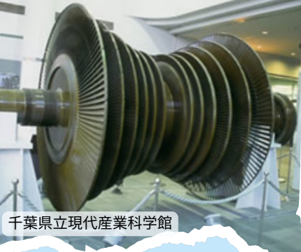
千葉県立現代産業科学館