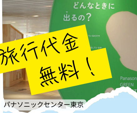
パナソニックセンター東京