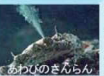
あわびのさんらん