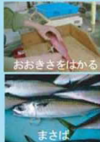
おおきさをはかる