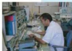
ぎよぎょうむせん

インターネットやむせんなどで、24じかん、いろいろなじょうほうをおしらせしています。