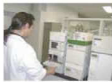
アミノさんぶんせき