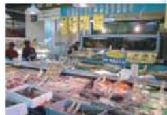
さかなや (イメージ) ます。