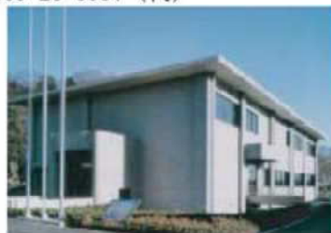
神奈川県水産技術センター内水面試験場 〒252-0135 相模原市緑区大島3657 電話042-763-2007 (代)