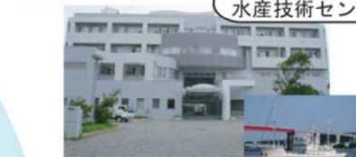
神奈川県水産技術センター 相模湾試験場 〒238-0237 三浦市三崎町城ヶ島養老子 電話 046-882-2311 FAX 046-881-7903