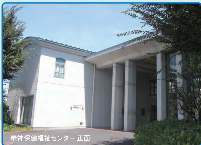
精神保健福祉センター 正面