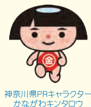
神奈川県PRキャラクター かながわキンタロフ