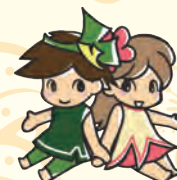
神奈川県自殺対策普及啓発用キャラクター いちりゅうくん・やまゆりちゃん

また、「かながわ自殺対策計画」に基づいた事業を市町村や関係機関、団体等と連携して実施しています。