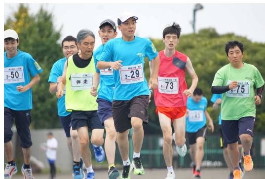
2024年神奈川夏季地区大会 陸上

〈県内の活動〉※2023年実績 年間トレーニング回数 800回以上(累計) 年間参加アスリート実数 339名/ボランティア107名 神奈川地区大会の開催 〈国内大会〉それぞれ4年に一度 夏季競技・冬季競技のナショナルゲーム(全国大会)に選手団を派遣 〈世界大会〉それぞれ4年に一度 夏季競技・冬季競技のワールドゲーム(世界大会)に選手団を派遣