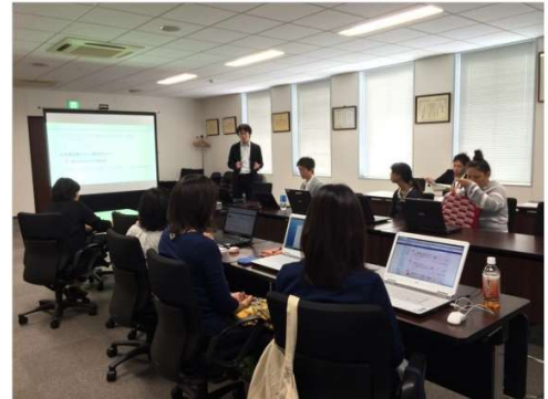
テレワークの研修会

このような、三浦半島ならではの多様な働き方が実現できる仕事スタイルの確立、そのための就労機会の創出を進めます。