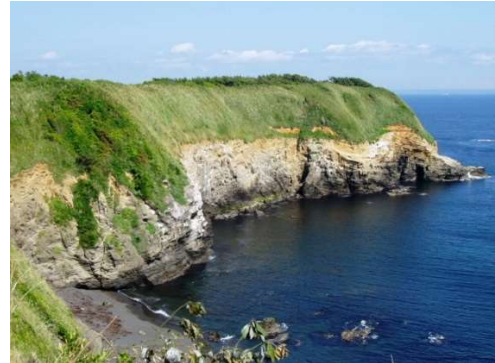
城ヶ島（ウミウ展望台） （シユェン・ケリノガイト・ジャポソ★★）

三浦半島は、空の玄関口となる東京国際空港（羽田空港）からのアクセスが良く、さらに、相模湾は、江の島で開催するオリンピック・セーリング競技の舞台となりますので、大会後も見据え、外国人旅行者を呼び込み（インバウンド需要の取込み）、三浦半島の国際的な知名度を上げることができるよう、外国人観光客等の受入環境づくりを進めます。