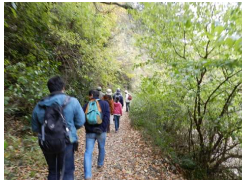
ウォーキング（二子山）