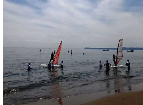
ウインドサーフィン体験