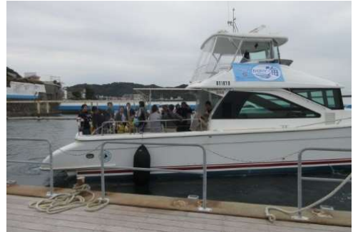
クルージングツアー

このように“みなと”は、三浦半島の豊かな自然や海からの恵みを象徴する地域資源となっていますので、その賑わいをつくるための取組みを進めます。