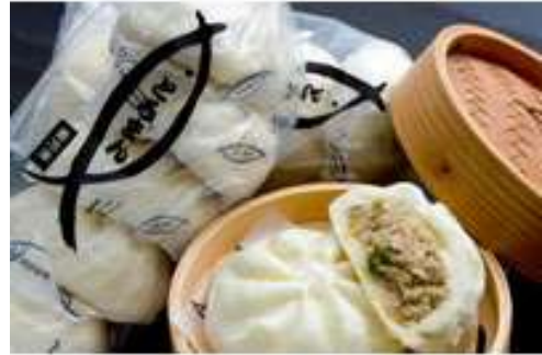
とろまん(6次産業化による地域活性化例)

そこで、既存産業高付加価値化、企業誘致、漁港のブランディング、整備などを進めることで、稼ぐ力を高め、地域の活性化を進めます。