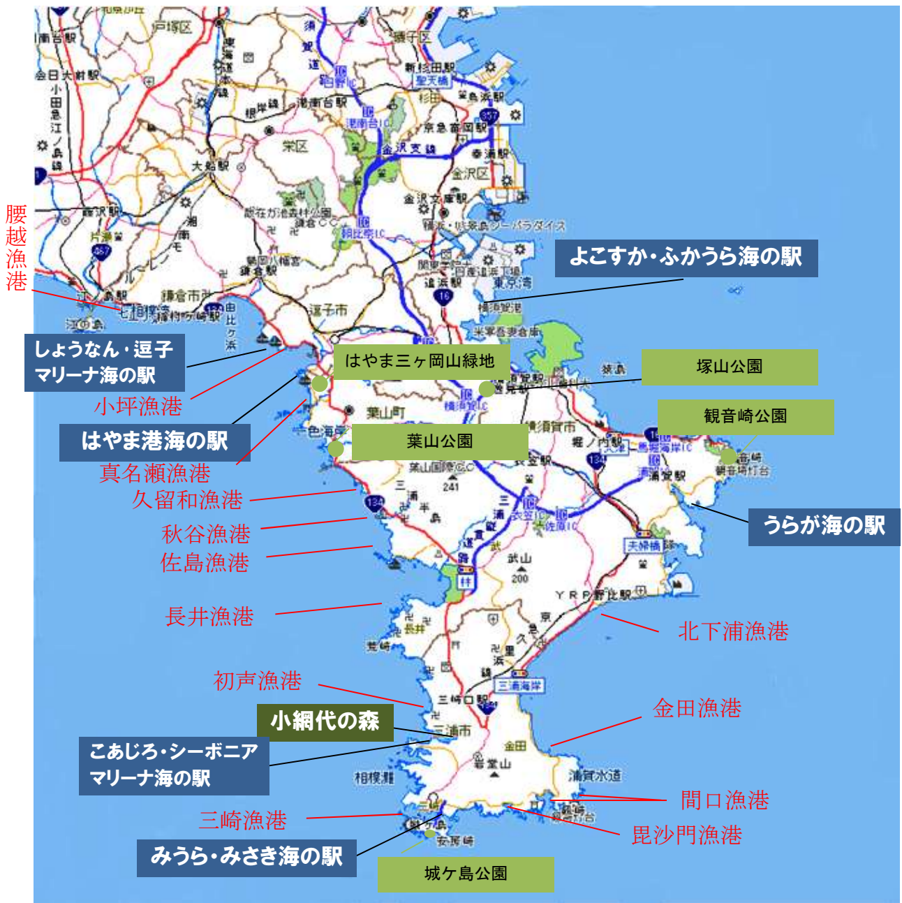
【図1 三浦半島地域に所在する漁港、海の駅等】