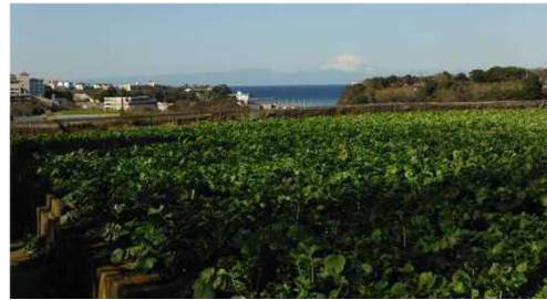
ダイコン畑（三浦市）