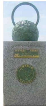
湘南国際村センターに設置（ツツジ）