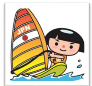
神奈川県のマスコットキャラクター かながわキンタロウ