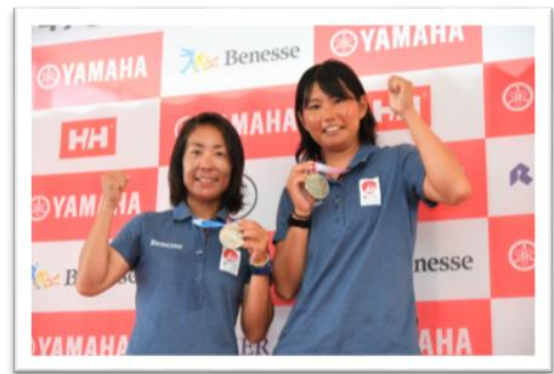
2019年8月クラス別世界選手権（江の島）で銀メダルを獲得

会場の江の島は、小さいころから練習して育ってきた場所で、地元のような感覚です。自分にとって、これは願ってもないチャンスだと思います。外国の選手も、オリンピックに向けてレベルアップしてくると思いますが、知り尽くしている環境で有利な部分が必ずあると信じているので、最高のパフォーマンスを発揮したいですし、最高の結果を残したいと思っています。