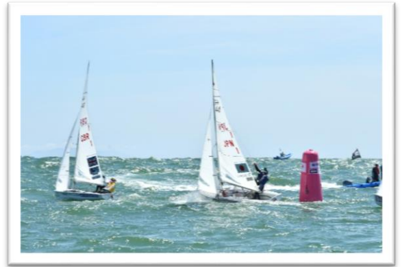
マーク際での順位争いは、競技の見所のひとつ

競技は沖の方でやるので、生で見るとは難しいのですが、最近では陸上でライブ映像を見ることができるようになっています。東京2020オリンピックでも、会場の近くにある片瀬東浜海水浴場で、大型スクリーンによる競技中継を予定しています。ダイナミックな動きや、接近戦での駆け引き、レースの重要な位置を占めるスタートも見所です。風の読みは見えても分からないと思うのですが、マーク際で順位が入れ替わっていくところは見えても迫力があるので、そういうところを見てもらえると、競技を楽しめるのではないかと思います。