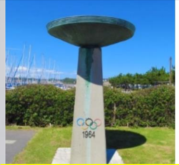
1964年東京オリンピックで使われた 聖火台（台座は復元したもの）