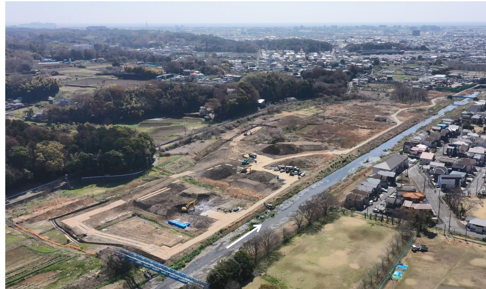
遊水地事業計画地 令和8年3月撮影