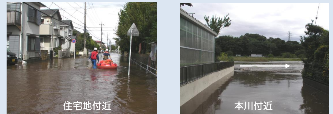
平成 26 年 10 月 9 日 台風 18 号（寒川町岡田八丁目地内）