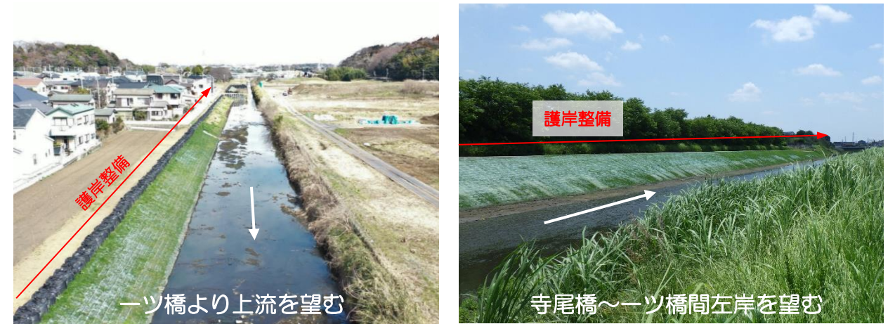
改修後の状況（本川）

※1 遊水地とは、洪水で川の水が増えた際、その水を一時的に貯め込み川の水位を下げる施設です。