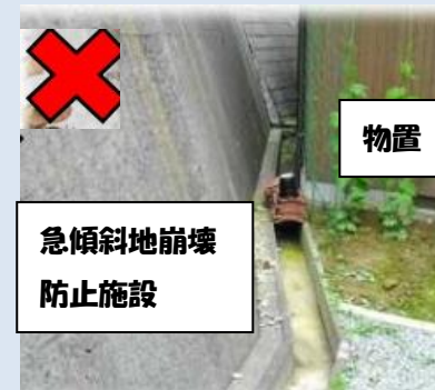
急傾斜地崩壊 防止施設