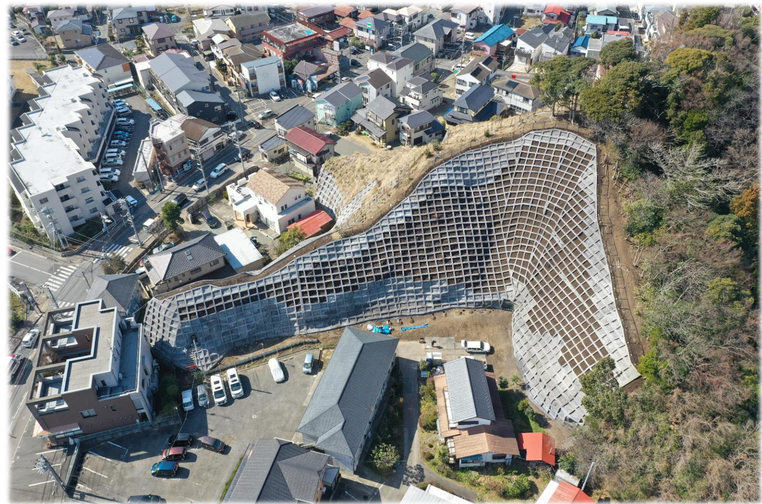
急傾斜地崩壊対策工事の状況（急傾斜地崩壊危険区域 植木D地区）