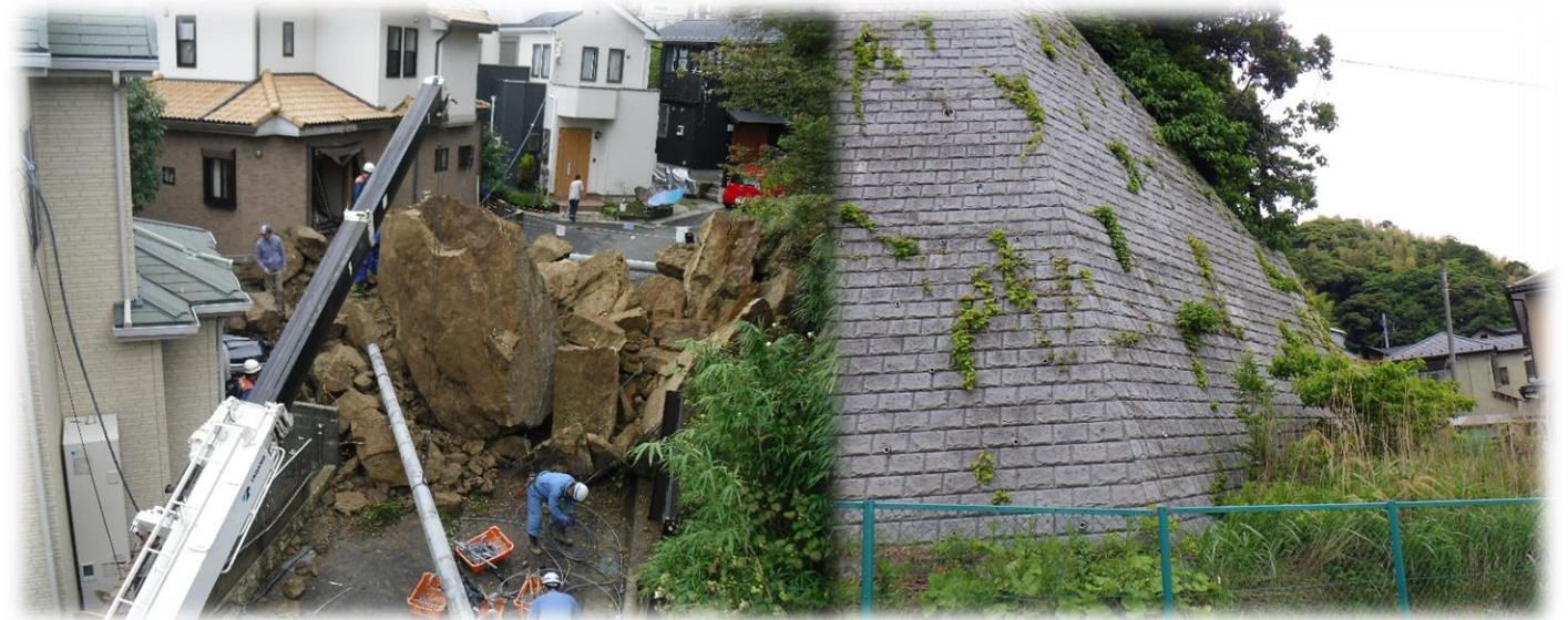
平成25年の落石事故