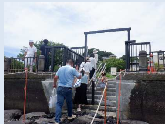
江の島上陸イベント時