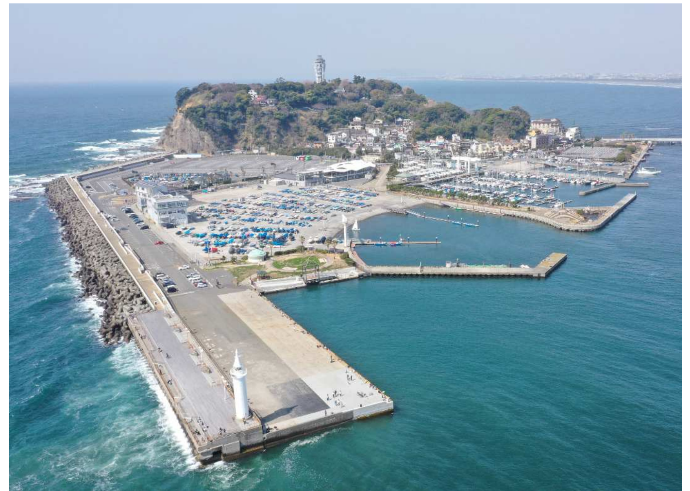
湘南港 令和7年撮影