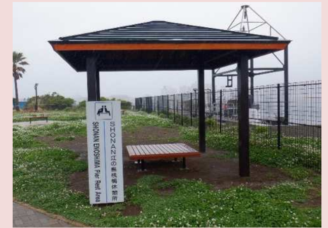
東屋（令和6年度整備）