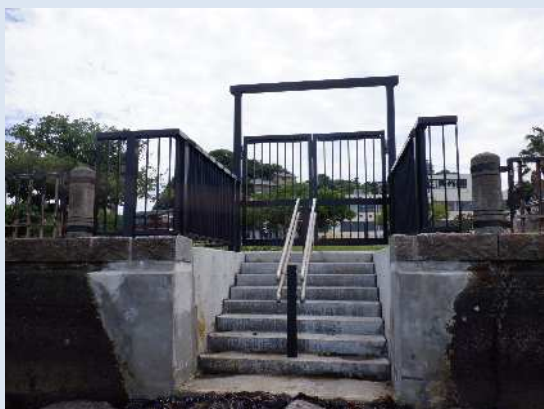
県管理用階段 令和7年5月完成