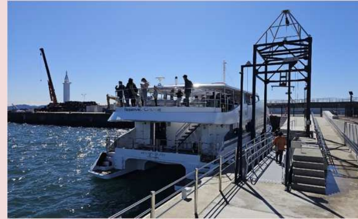
SHONAN 江の島棧橋（令和5年度整備）

現在は、係留施設「SHONAN 江の島棧橋」や東屋の整備を行うなど、マリーナ機能の強化や海洋ツーリズムの推進などに対応した取組を進めています。