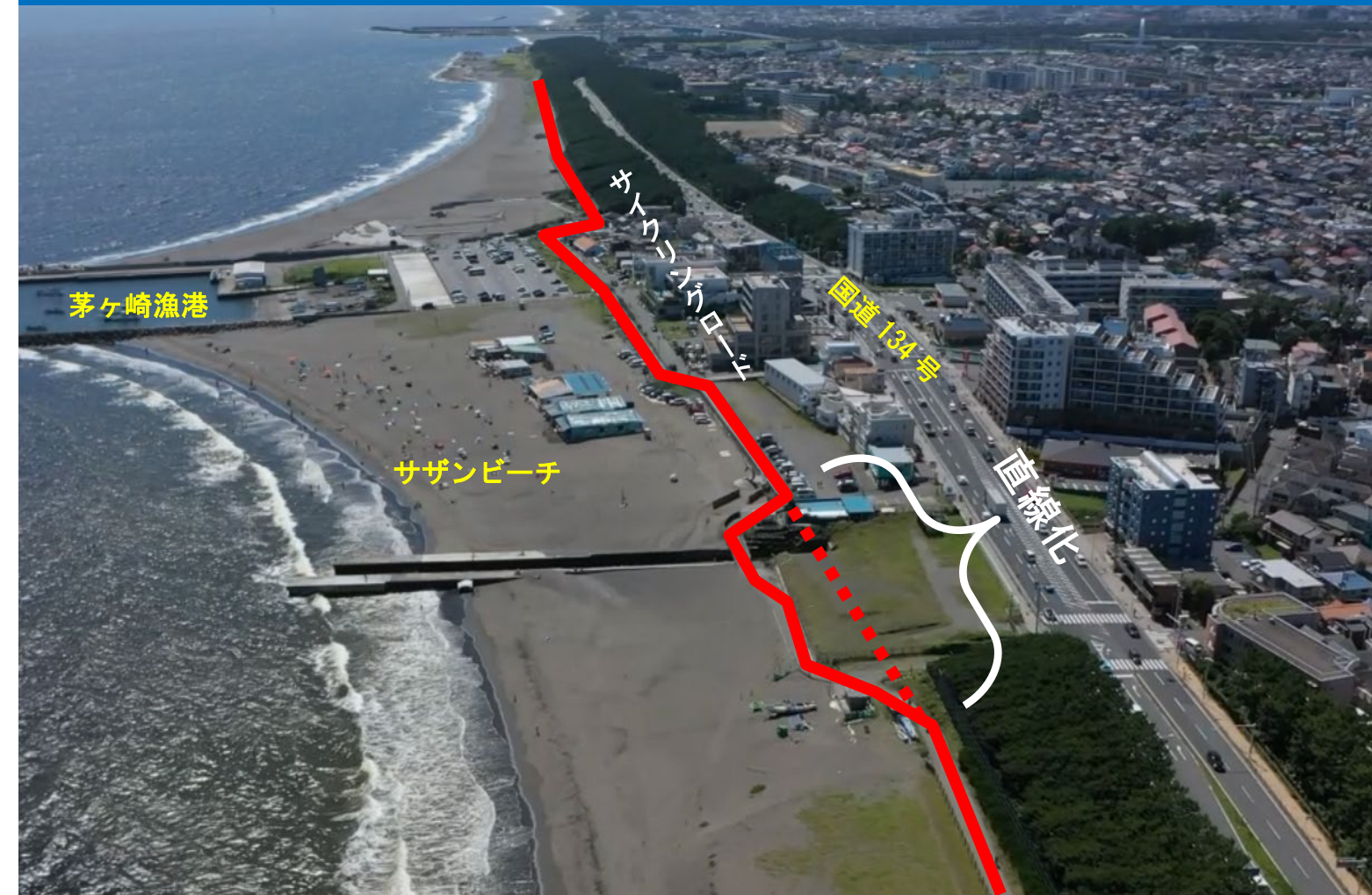
サイクリングロード 令和4年7月撮影