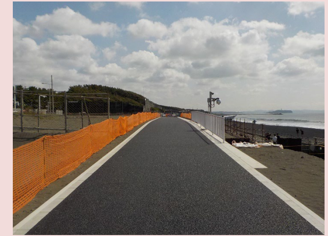
直線化供用後（令和8年3月31日）