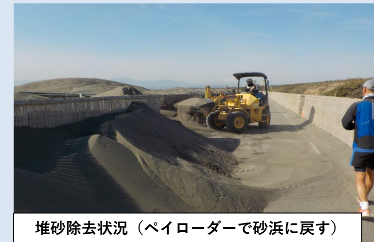
堆砂除去状況（ペイローダーで砂浜に戻す）