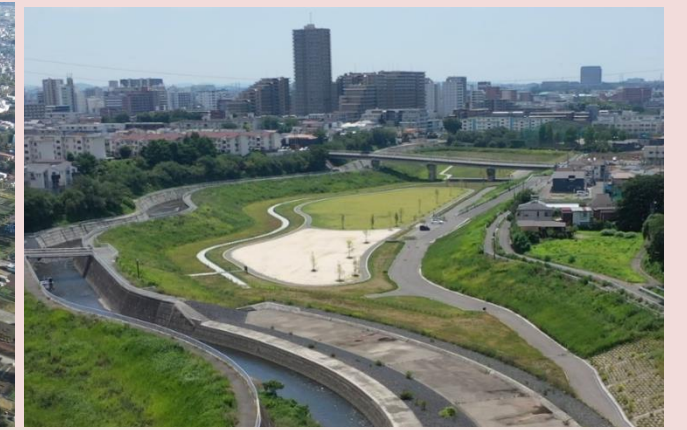
改修後の状況(下土棚遊水地A池)