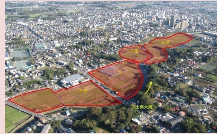
改修前の状況(下土棚遊水地)

現在、下土棚遊水地では、平常時に多目的利用が可能であることを活かし、地域の憩い・安らぎの場、地域活動・交流の場など新たな価値を創出することを目的として、上部利用施設の整備に取り組んでいます。