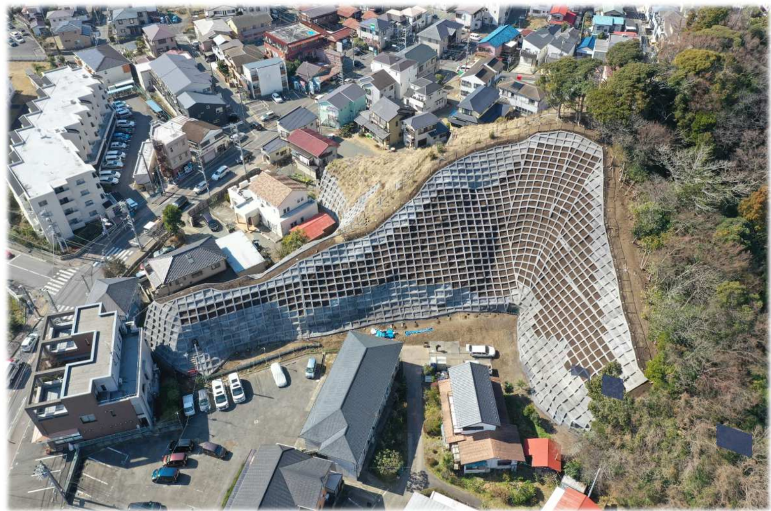
急傾斜地崩壊対策工事の状況（急傾斜地崩壊危険区域 植木D地区）