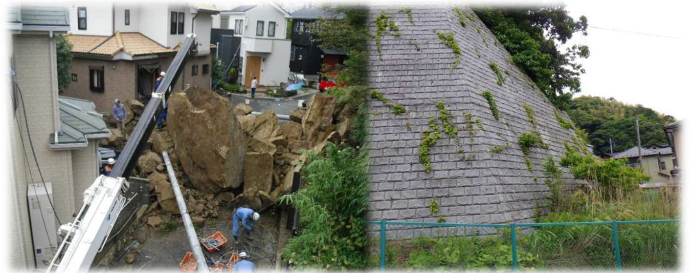
平成25年の落石事故