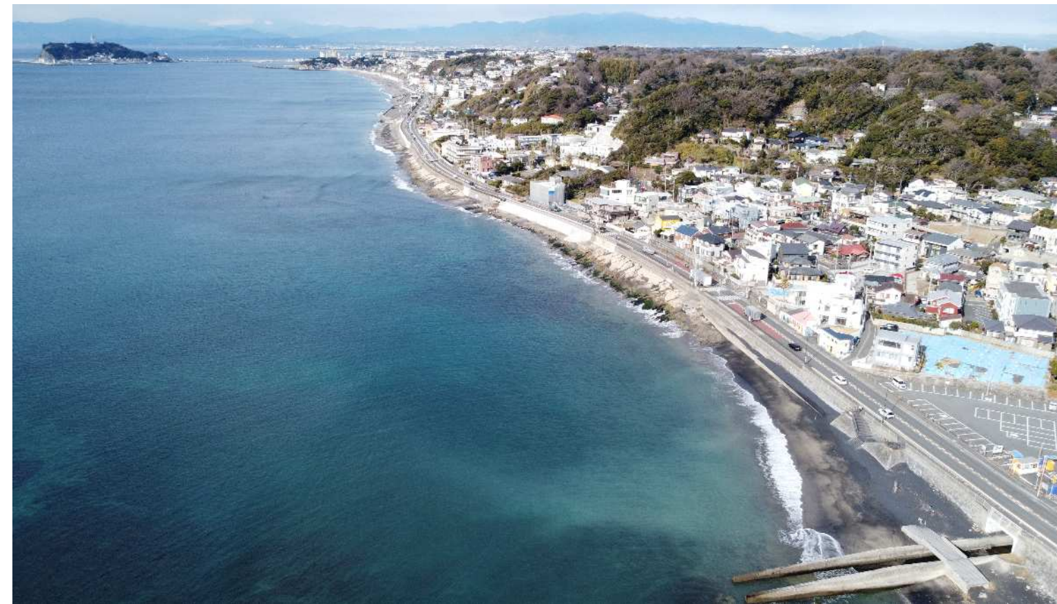
鎌倉海岸七里ガ浜地区 令和4年1月撮影