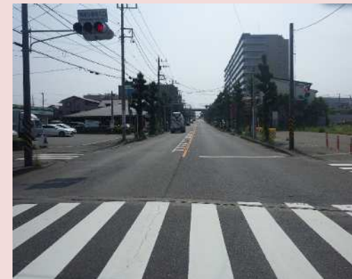
湘南台高校入口交差点