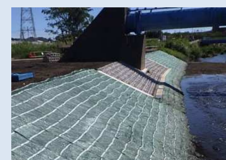
護岸ブロック+覆土構造