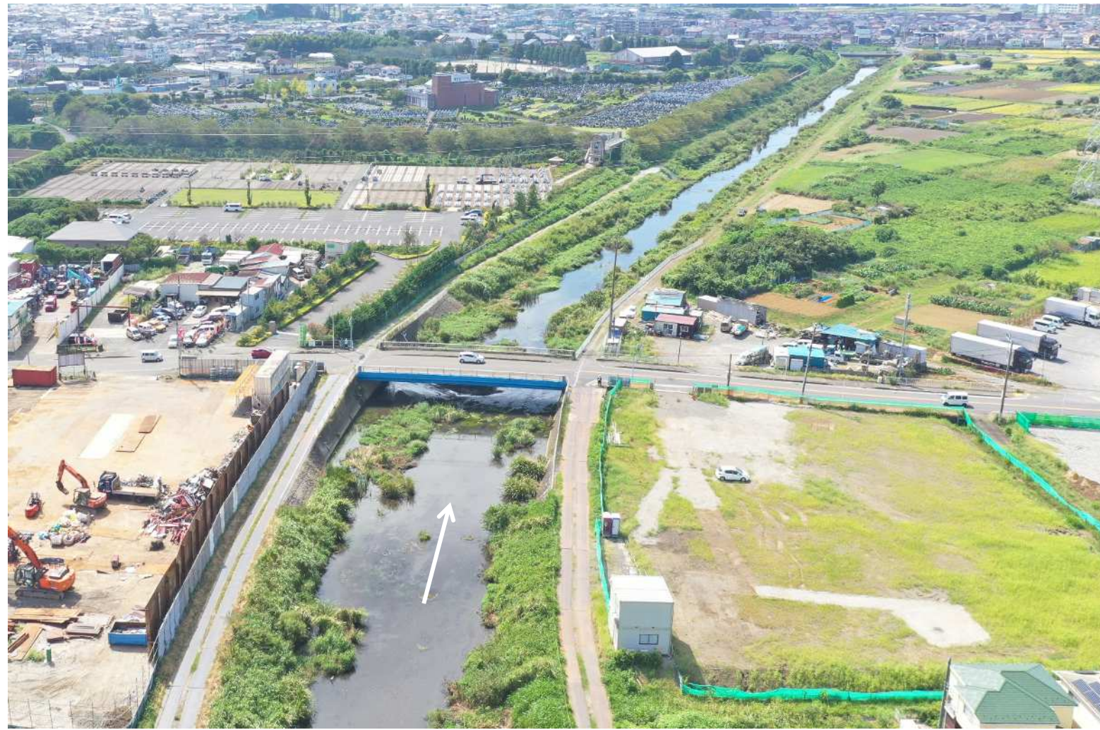
一ツ橋付近 令和6年11月撮影