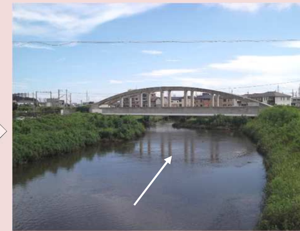
改修後の状況(寺尾橋下流)