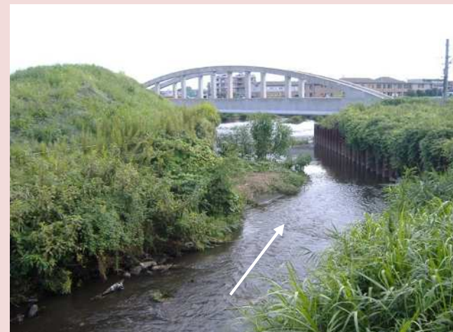
改修前の状況(寺尾橋下流)

※ 時間雨量 50mm とは、6.3 年のうち毎年約 16% の確率で生じる降雨量をいいます。