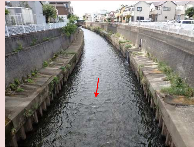
遊行寺橋上流（狭窄部）

特に、沿川に住宅等が連坦し、河道拡幅や河道掘削による整備が困難な藤沢橋付近の狭窄部で、治水対策の検討を進めています。