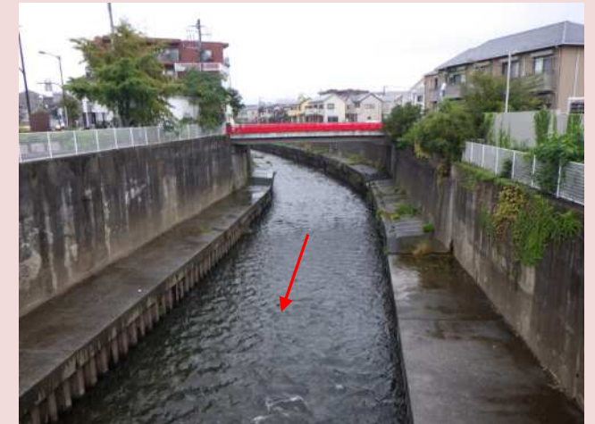
藤沢橋上流（狭窄部）