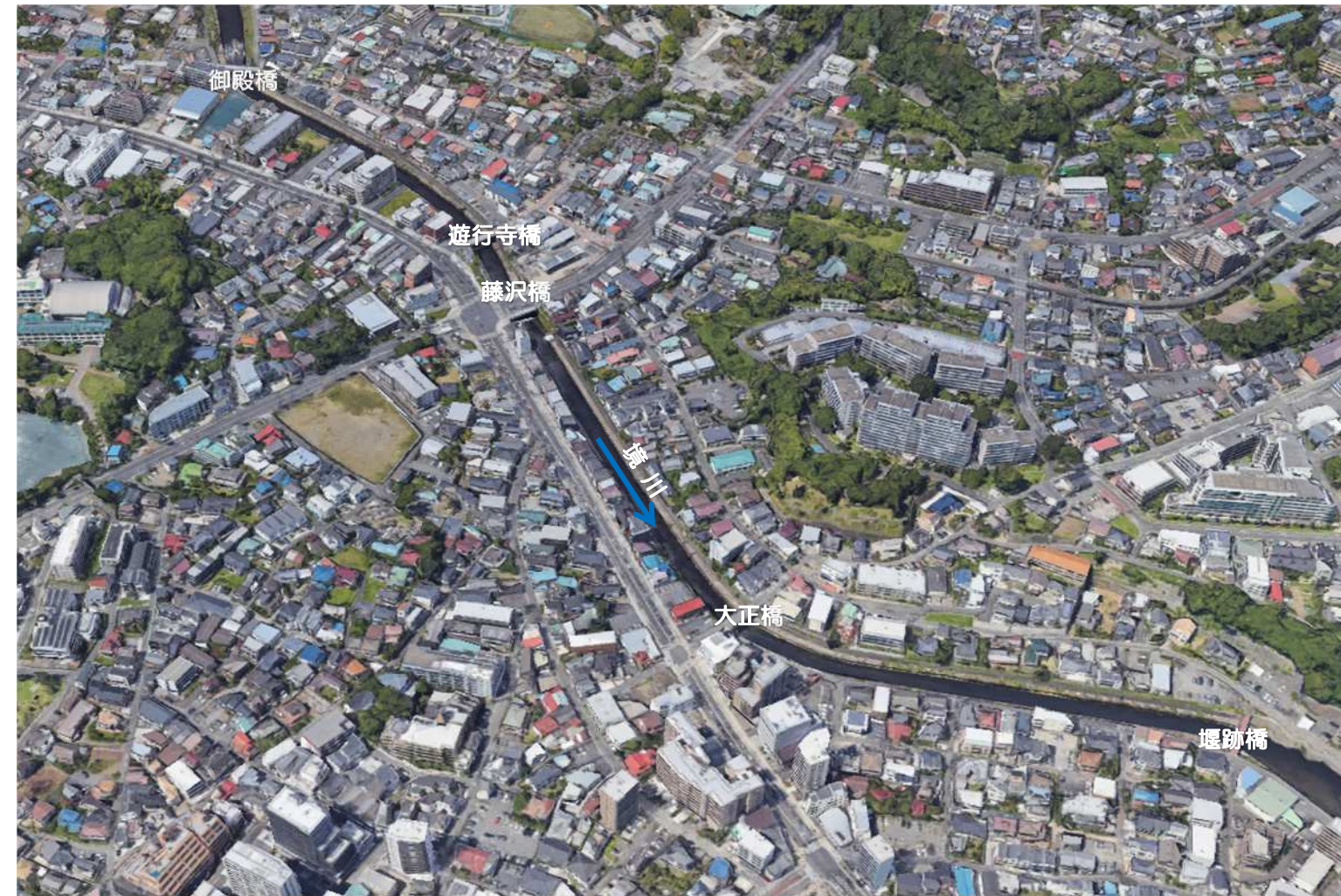
藤沢橋付近（狭窄部）