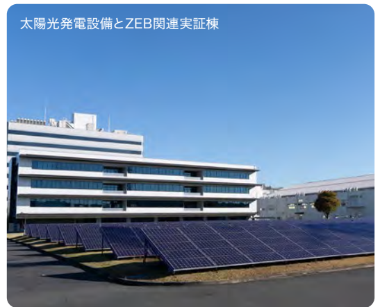
太陽光発電設備とZEB関連実証棟

鎌倉市内等の事業所において、再生可能エネルギーの導入を積極的に行うとともに、高効率な空調設備、変圧器、圧縮機等への更新や、自社で開発したZEB技術や電力監視技術を活用することで、事業所の省エネを推進している。また、ZEB技術のアピールも広く行っている。計画最終年度となる令和3年度は、これらの取組により基準年度(平成30年度)に対して約16%と、CO 2 排出量の大幅な削減を実現した。