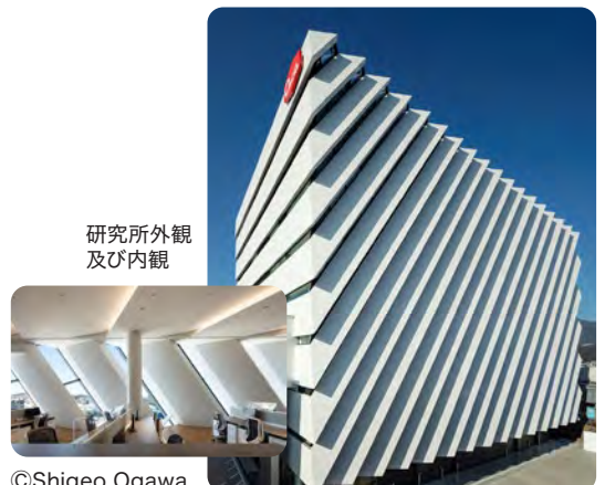
研究所外観 及び内観

令和2年に伊勢原市内に竣工した生命科学研究所新棟において、照明の自動制御や床吹出し方式の空調設備の採用等、室内環境向上に配慮するとともに、冷温水同時取出型チラーやデシカント空調機等の採用により、省エネルギーを図っている。さらに、用途別にエネルギー消費量を把握・分析可能な計画とし、節水器具やリサイクル材等を採用するなど、環境負荷削減に配慮し、県建築物温暖化対策計画書制度における評価システム(CASBEE ® )では最高のSランク評価となっている。