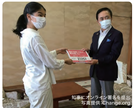
知事にオンライン署名を提出

高校生が脱炭素に関する問題意識をもち、自らできること及び効果的な手法を考えて行動に移したこの取組は、県立高校における再エネ電力導入の推進に対する後押しとなり、令和5年度には県内の全県立高校で再エネ由来の電力となった。