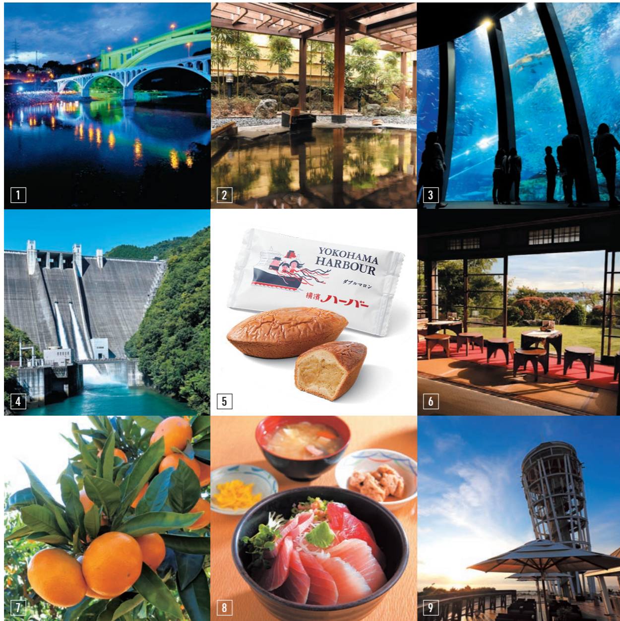
①小倉橋(相模原市) ②鶴巻温泉(秦野市) ③横浜・八景島シーパラダイス(横浜市) ④神奈川立あいかわ公園(愛川町) ⑤ありあけ本館ハーバースムーン(横浜市) ⑥清閑亭(小田原市) ⑦湯河原みかん(湯河原町) ⑧三崎のまぐろ(三浦市) ⑨江の島シーキャンドルサンセットテラス(藤沢市)