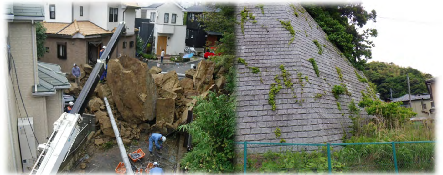
平成25年の落石事故