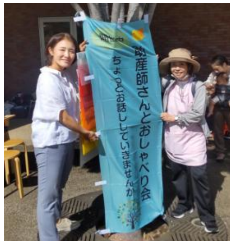
助産師さんとお話、育児相談