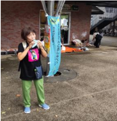
オカリナ奏者さんの演奏