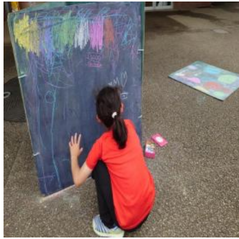
大型黒板お絵かき