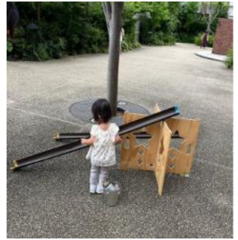
手作り雨どいコロコロ