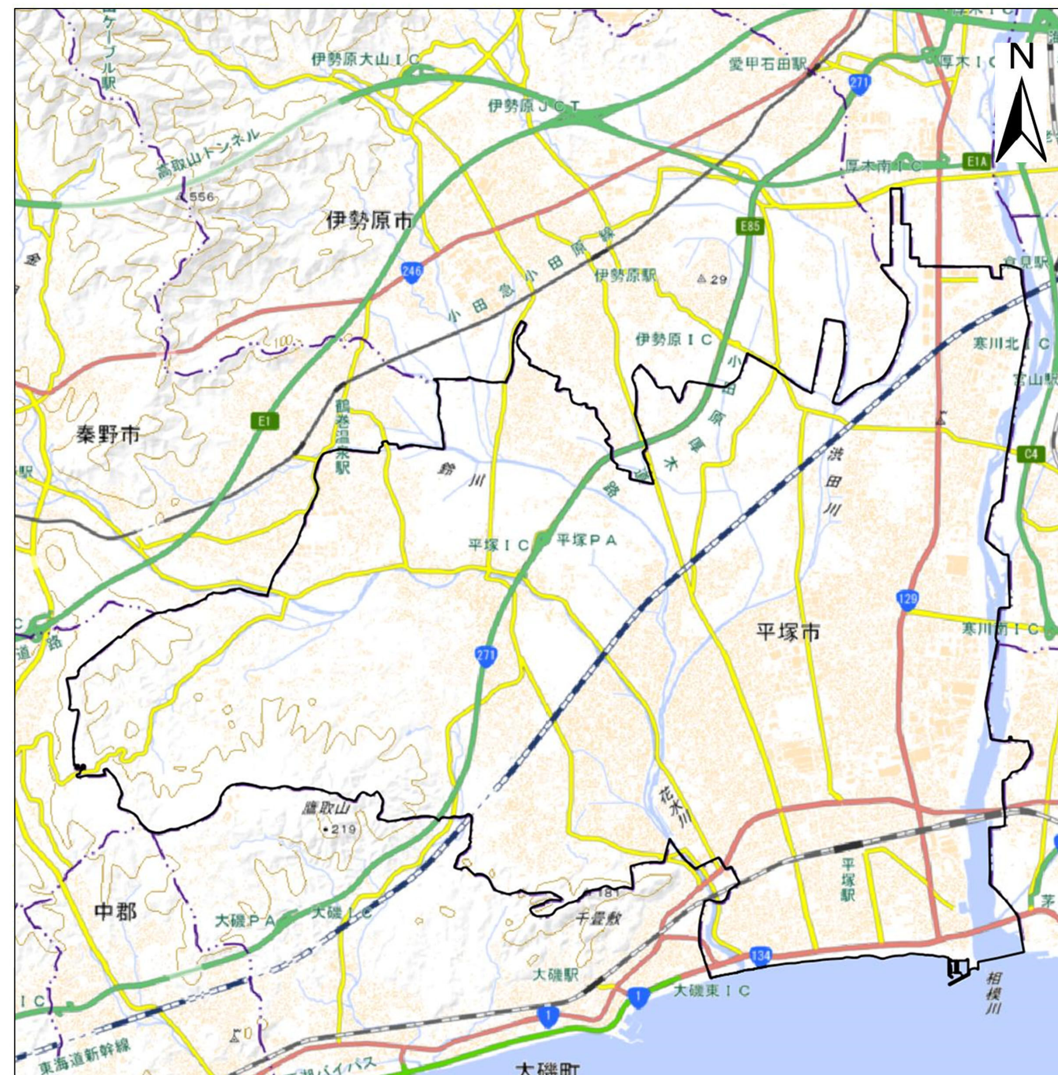
詳細位置図 (S= 1:60,000) (A2)