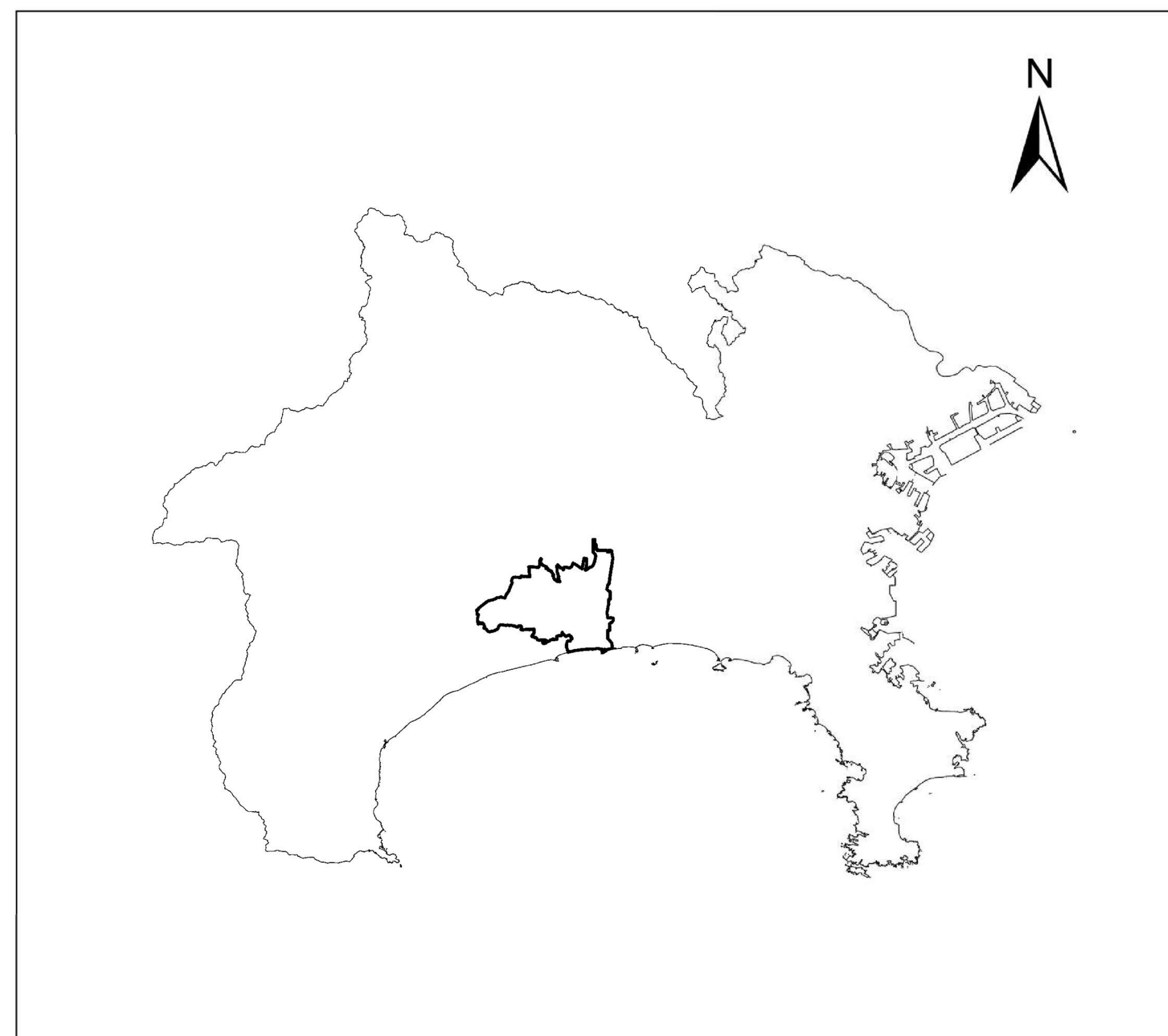
全体位置図 (S=1:500,000) (A2)