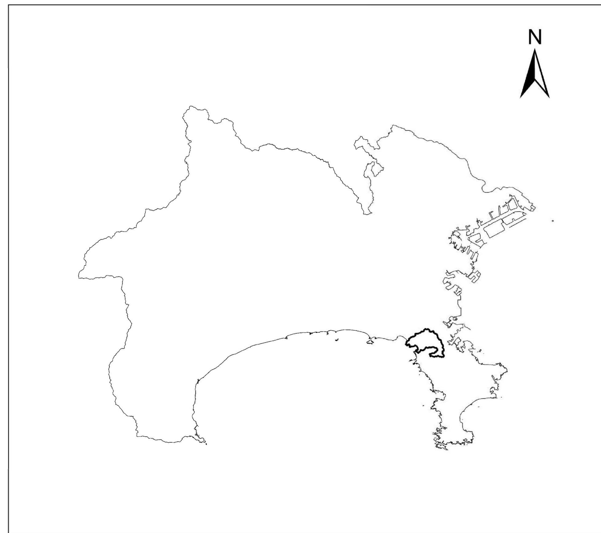
全体位置図 (S=1:500,000) (A2)