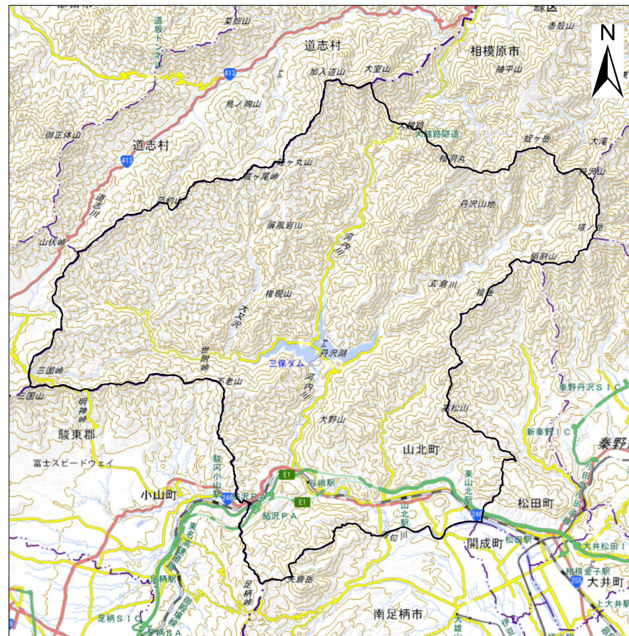
詳細位置図 (S= 1:110,000) (A2)