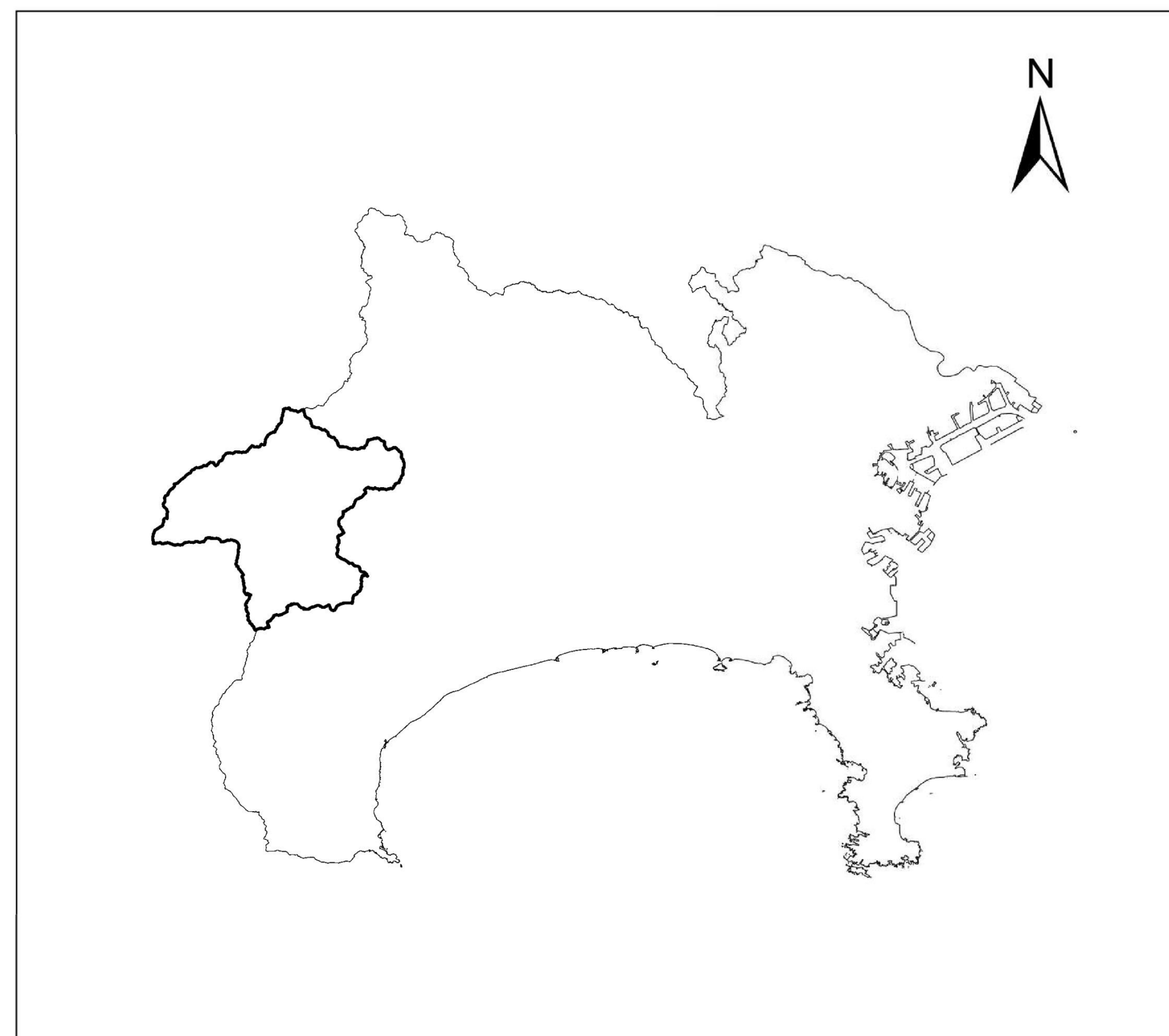
全体位置図 (S=1:500,000) (A2)