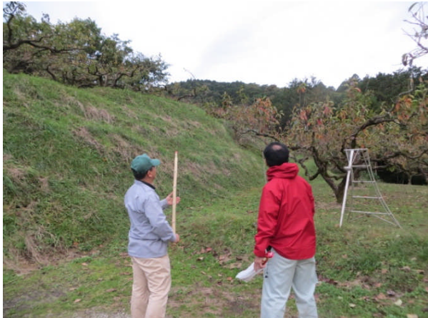
写真3-1 ツキノワグマ追い払いの様子 [伊勢原市大山・子易]