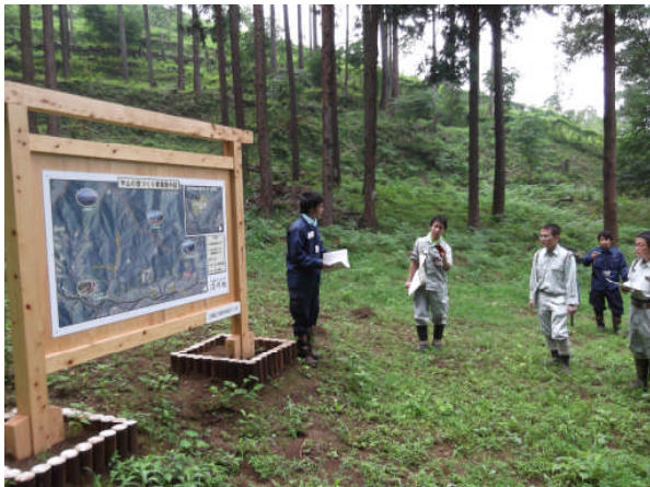
写真3-3 水源林整備地の現地検討会の様子 [清川村煤ヶ谷]

統合再生プロジェクト（東丹沢2エリア）として、エリア内の水源林整備や鳥獣被害対策等の実施状況、効果及び課題等について、行政関係者（県及び村）が現地検証を行った結果、関係者間で課題、今後の取組等の共有を図ることができた。