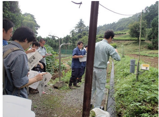
写真3-4 野生動物忌避装置の現地検討会の様子 [清川村煤ヶ谷]