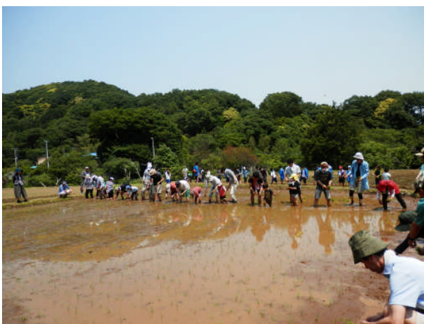
写真3-5 農地を活用した農作業体験の様子 [厚木市七沢地区]