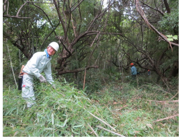
写真3-2 集落環境整備の様子 [伊勢原市大山・子易]