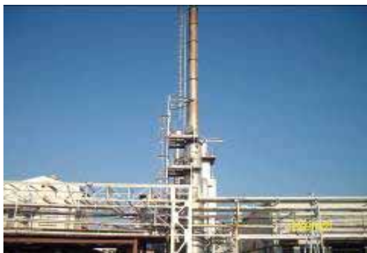
ロータリーキルン方式焼却炉

焼却施設の維持管理は難しい側面も多いですが、このバーコードシステムを活用した投入廃棄物の質や量の調整等により、現在まで特段の問題もなく稼動することが出来ております。