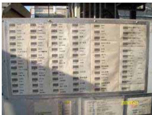
リサイクル用バーコード分類

社内焼却するものは焼却場で、リサイクルするものは分別作業場で、それぞれ計量され、計量と同時にバーコードを読み取ることで、いつ、どのラインから、どのような廃棄物が、何 kg 排出されたかがデータベースに記録されます。