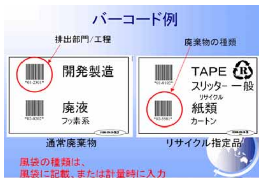
バーコードの一例

この記録を基に、月ごとの排出量を集計し結果をフィードバックすることで、各部門やラインごとの廃棄物削減活動の基礎データとして活用します。これにより、廃棄物管理者が分別方法やリサイクル化などの提案を行ない易くなりました。