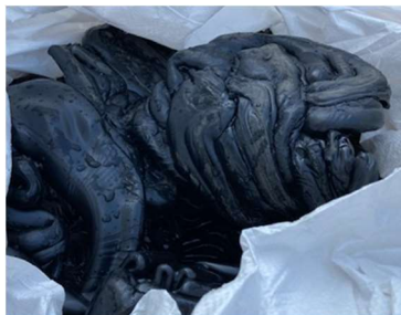
PE オーバーフロー層

PEオーバーフロー層は年間105トン（削減取組前の2018年度実績）発生。廃プラスチック排出量の16%を占めている。弊社では横浜製作所の他に大阪製作所、伊丹製作所、茨城製作所と4か所の製造拠点があり、拠点間の交流で優良な委託会社の情報交換を実施。PE売却先の有力な情報が入手でき、サンプル評価を経て、PEオーバーフロー層の有価売却に成功。更に光ファイバ巻取用ABS素材のボビンも廃棄物として発生している事から、同じ委託会社でサンプル評価を実施した結果、こちらも有価購入頂けることになった。