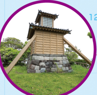
三浦半島八景 燈明堂 Tomyodo, one of the Eight Picturesque Views of Miura Peninsula MAP K-10