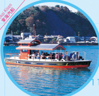
浦賀の渡し Uraga no Watashi MAP K-10