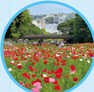
くりはま花の国 Kurihama Flower Park MAP J-11