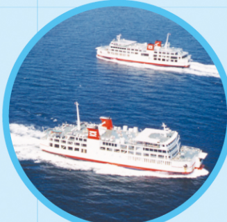
東京湾フェリー Tokyo-Wan Ferry MAP J-11