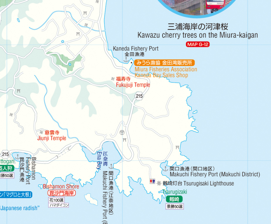
三浦海岸の河津桜 Kawazu cherry trees on the Miura-kaigan