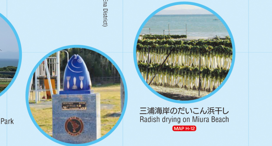
三浦海岸のだいこん浜干し Radish drying on Miura Beach