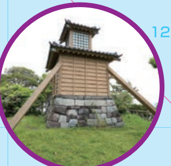
三浦半島八景 燈明堂 Tomiyodo, one of the Eight Picturesque Views of Miura Peninsula MAP K-10