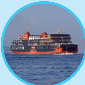
東京湾フェリー Tokyo-Wan Ferry MAP J-11