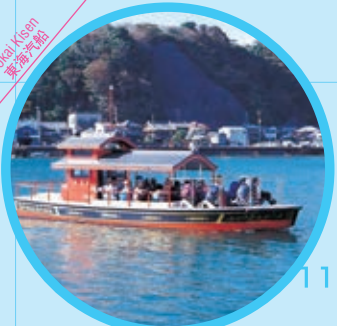
浦賀の渡し Uruga Ferry "Uruga no Watashi" MAP K-10