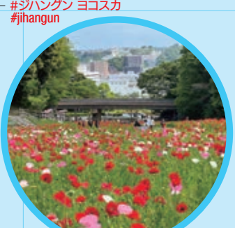
くりはま花の国 Kurihama Flower Park MAP J-11