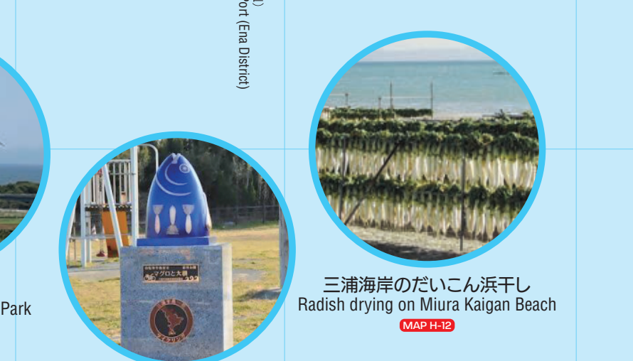
三浦海岸のだいこん浜干し Radish drying on Miura Kaigan Beach MAP H-12