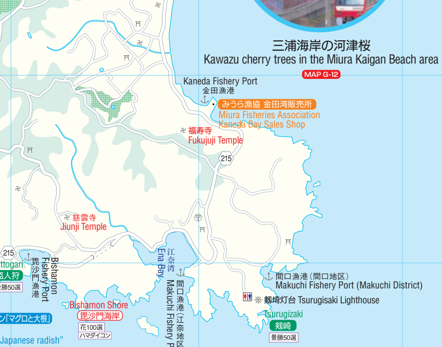
三浦海岸の河津桜 Kawazu cherry trees in the Miura Kaigan Beach area MAP G-12