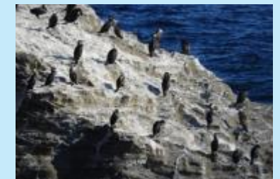
ウミウ Japanese Cormorant

Japanese Cormorants fly from the Kuril Islands every November, build a nest on the cliffs of the island and live there until April of the following year. The habitat of Japanese Cormorant is a natural monument designated by Kanagawa Prefecture.