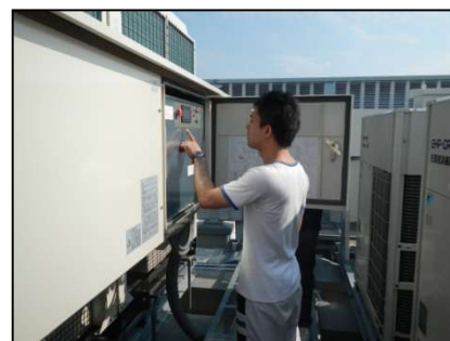
冷凍機・空調保守