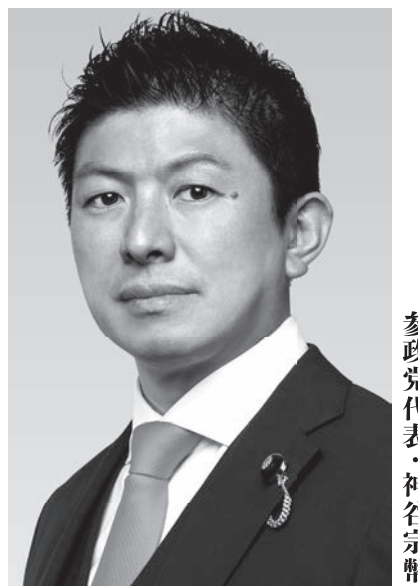
参政党代表・神谷宗幣