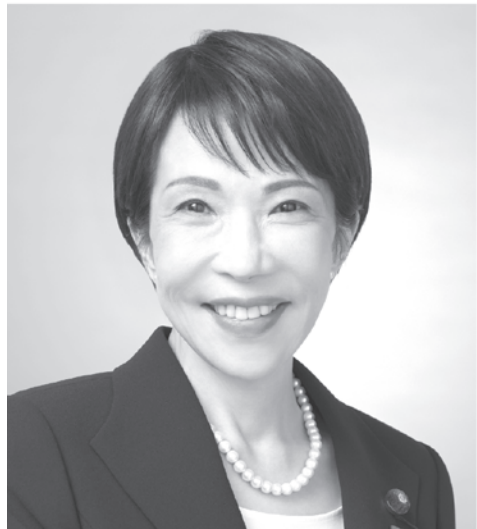
自民党総裁 高市 早苗 たかいち さなえ