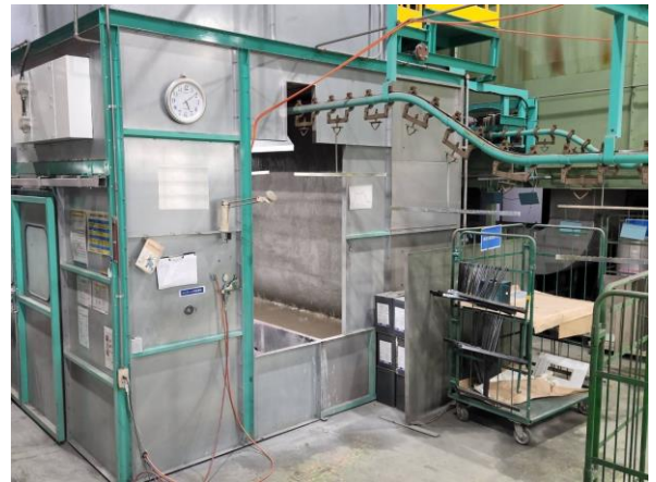
設備写真：金属塗装（素材をハンガー治具に取り付け、ライン設備にて焼付塗装）

精密板金から焼付塗装、組立まで自社で完結する「ワンストップ一貫生産体制」が強みである。特に高度な技術を要する薄板加工に定評があり、工程集約による短納期と徹底した品質管理を両立。熟練の技と最新鋭の設備を融合させ、高品質な製品を安定供給している。